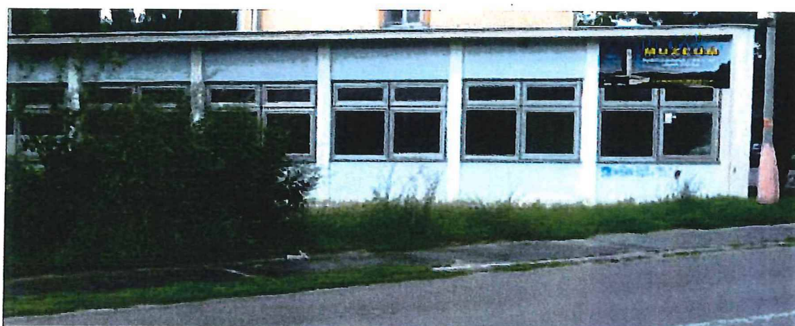
informačná tabuľa na budove pri pohľade z Partizánskej ulice