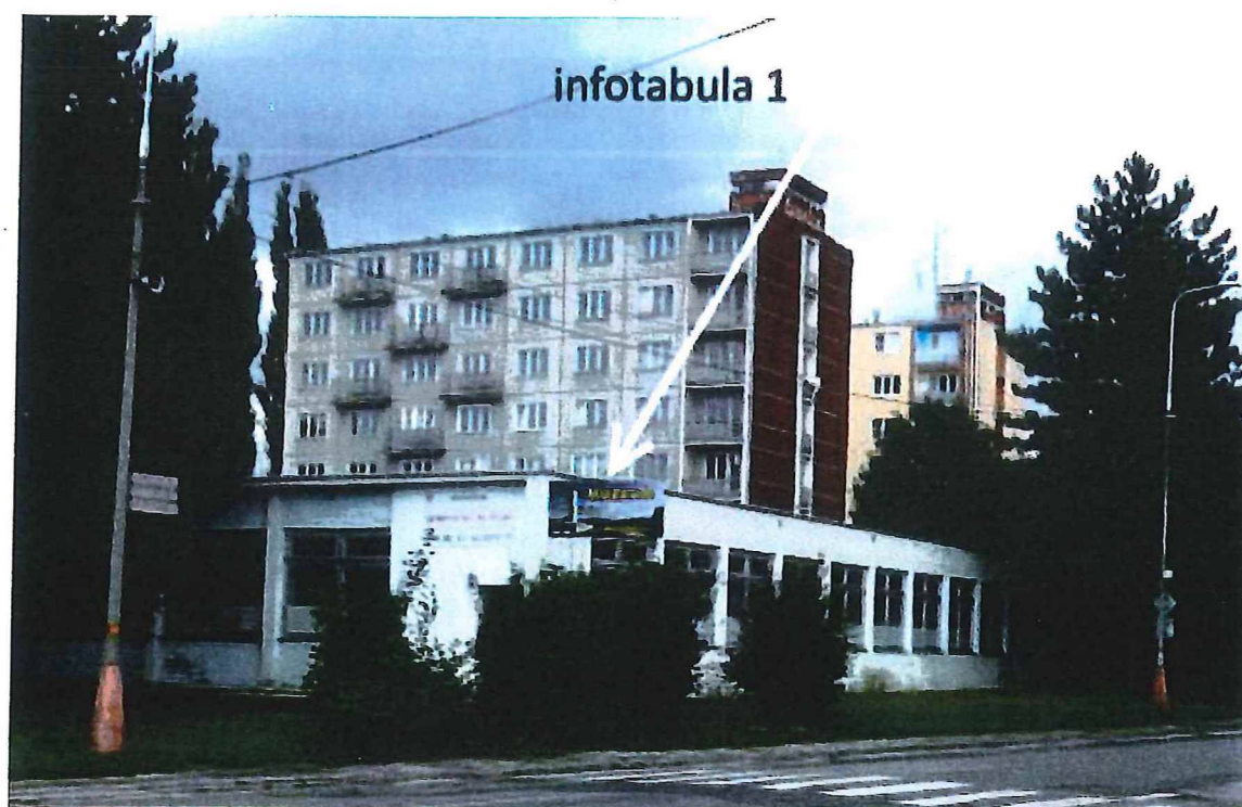
informačná tabuľa na budove pri pohľade z ULICE A. HLINKU